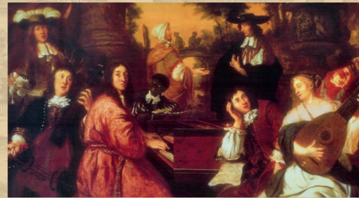
„Musizierende Gesellschaft“ von Johannes Voorhout (1674): J. A. Reincken (am Cembalo), D. Buxtehude (als Gambist), evtl. J. Theile (mit Notenblatt)

Wenn es den jungen Johann Sebastian Bach im Herbst 1705 nach Lübeck zog, „um daselbst ein und anderes in seiner Kunst zu begreifen“, dann war die vielschichtige Musikerpersönlichkeit Buxtehude der eigentliche Anziehungspunkt. In den vier Jahrzehnten seiner Lübecker Tätigkeit unterhielt der Marienorganist zugleich enge Kontakte nach Hamburg, wo eine Reihe hervorragender Komponisten, Organisten, Kantoren und Musikdirektoren zu seinem Freundes- und Bekanntenkreis gehörten, darunter Johann Adam Reincken, Johann Theile, Christoph Bernhard und Matthias Weckman. Die berühmte „Musizierende Gesellschaft“ von Johannes Voorhout (1674) ist ein eindrucksvolles Dokument dieser Beziehungen.